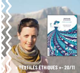
TEXTILES ÉTHIQUES » - 20/11

Après avoir échangé autour de la mode éthique, place à la pratique ! Venez donner une seconde vie à vos vêtements pour les transformer en porte-monnaie, pochettes. Sur inscription : ijlonslesaunier@jeunes-bfc.fr .