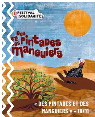
« DES PINTADES ET DES MANGUIERS » - 18/11